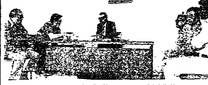
المحافظة تياض مع وفد المسومنة

في نطاق مساعي تحقيق مصالحهم واعادة المهجرين في الشوف زار القائمون الشوف مسيح الصلح بدة الباروك واجتمع الي اعضاء البلدية ، والس وجوه البلد في مقر البلدية . اذبح القائمون الصلح الاجتماع بكلمة دعا فيها الي ابناء الباروك والناخبي بين الدروز والسحيين في الشوف ، وبين المسحيين عامة وبين المسحيين في تلك المنطقة . وقال : « لبنان ليس للمسيحيين وحدهم ، وليس للمسيحيين وحدهم ، انه لنا جميعا وبالنسبة لمسيحيين ومسيحيين .. لبنان بطنهم المسلم والسحيين ويؤمن حين الجناسين لا يستطيع ان يفهم » . وحث القائمون الصلح على التعاطي فوق الجراح ، ودعا ابناء الباروك ان يتصلوا هم ، بلخواصهم المسحيين الذين هاجروا ، ويظهروهم على العودة وان يفخروا لهم كل التبليغات . واستفسر القائمون بعد ذلك عن احوال كنيسة القديس جاورجوس في الباروك ، وتم اعضاء البلدية وجوه الباروك زيارتها وفتحها ، ودمما الجميع الي المحافظة عليها ، الي ان يعود اليها « اوتراكم في المواطنين والانسانية وحيه لبنان » . وحث القائمون الصلح وجوه الباروك واعضاء المجلس البلدي على الاتصال بكاهن الكنيسة ، والتضي عليه بالعودة واقامة القداس كل يوم احد . ... الي يعقبن ومن الباروك انتقل القائمون الصلح الي بعلبكن ، حيث تم لقاء بينه وبين حشد كبير من المواطنين ، في القاعة الكبرى للمدرسة الوطنية يتقدمهم الوزير السابق سعيد حماده ، وعدد من وجوه بدة بعلبكن واعضاء المجلس البلدي . افتتح اللقاء بكلمة باسم الجمعية